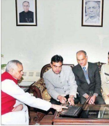
शिमला : राज्यपाल आचार्य देवव्रत हिमाचल प्रदेश राज्य रेड क्रॉस की वेबसाइट का शुभारंभ करते हुए

दिव्य हिमाचल Wed, 01 February 2017 epaper.divyahimachal.com//c